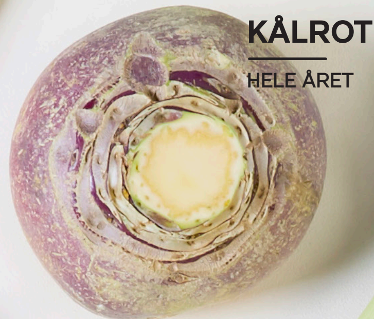
KÅLROT HELE ÅRET