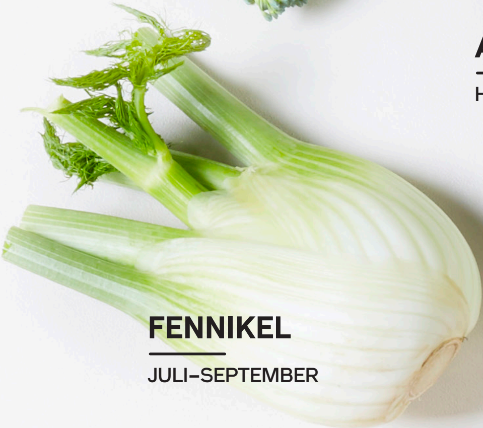
AGURK HELE ÅRET