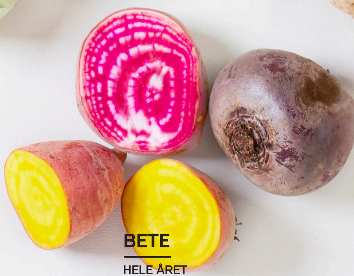
BETE HELE ÅRET