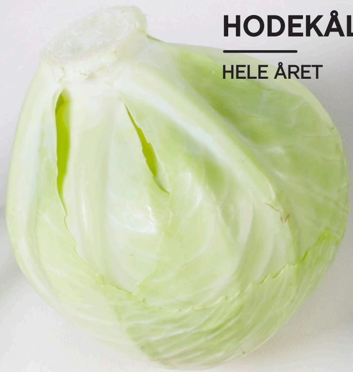
HODEKÅL HELE ÅRET